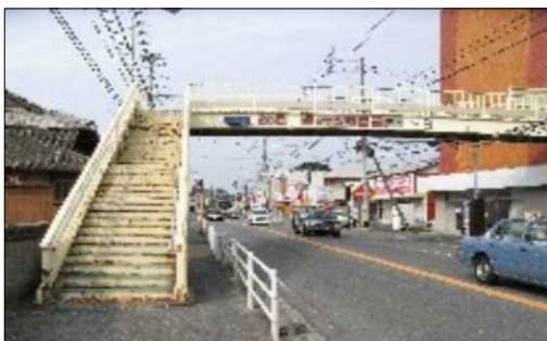
歩道橋の利用調査