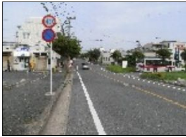
歩道のフラット化

旧三号線(国道495線)のクボタ前から美和台入り口までの道路は、大型車などの交通により、わだちができています。今年には舗装のやり変えを実施します。夜間工事となるため、むさ苦しい夏を避け、秋に行います。