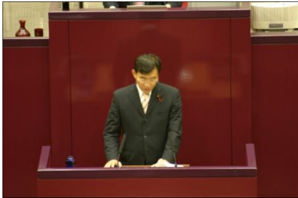
9月議会で質問しました

私は公約として、高齢化の進む美和台では、 一 三苦駅にエレベーターを設置する 二 歩道をフラット(平坦)にすること 三 将来は地域内での100円バスや500円タクシーを運行させる。 と訴えてまいりました。