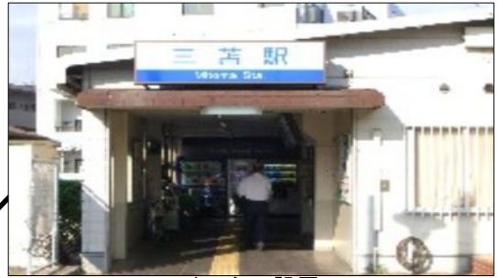
エレベーター設置